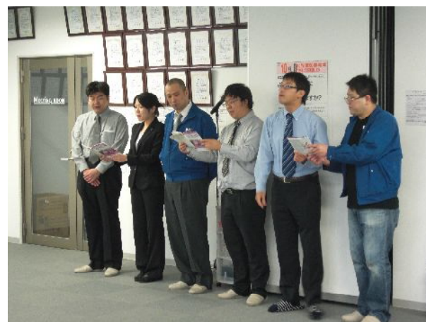
朝礼は早朝勉強会の 考えを元に行います