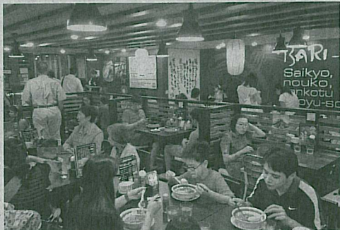
既にシンガポールでは直営店を展開(シンガポールの「ばり馬」)