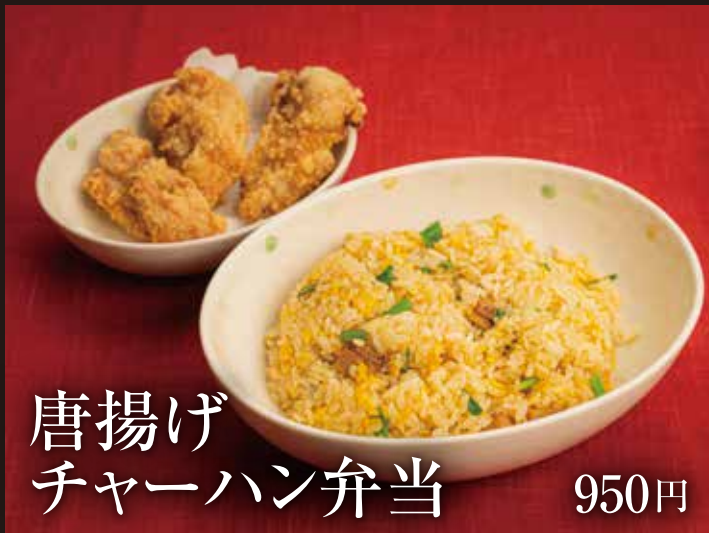
唐揚げ チャーハン弁当 950円