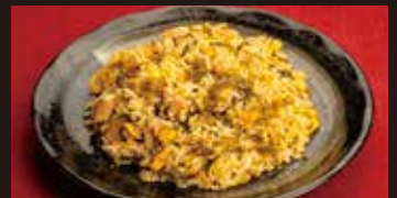
高菜チャーハン 950円