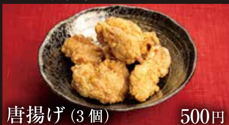
唐揚げ (3個) 500円