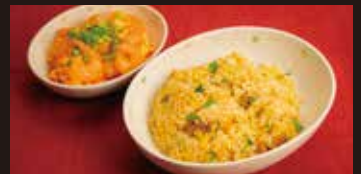
海老と卵のチリソース チャーハン弁当 1,350円