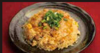
焼肉チャーハン 1,150円