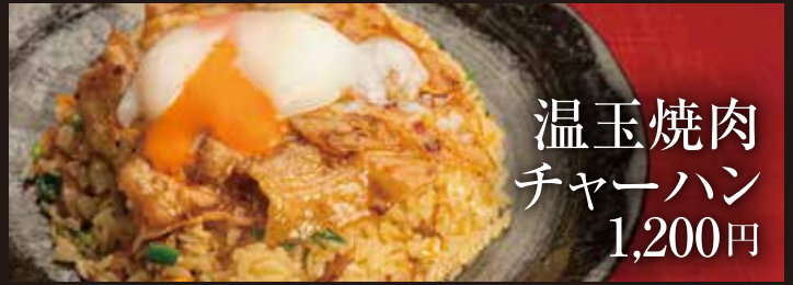
温玉焼肉 チャーハン 1,200円