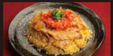
キムチ焼肉チャーハン 1,200円