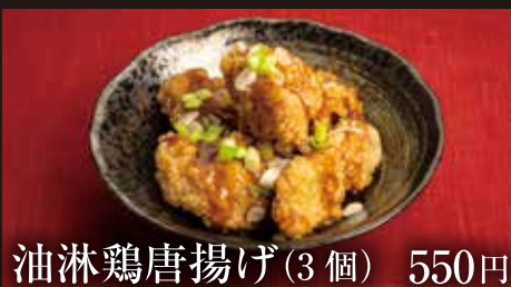
油淋鶏唐揚げ (3個) 550円