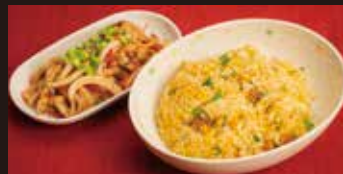
焼肉チャーハン弁当 1,250円