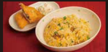
白身フライ チャーハン弁当 1,250円