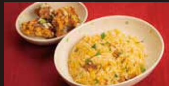
油淋鶏唐揚げ チャーハン弁当 1,000円