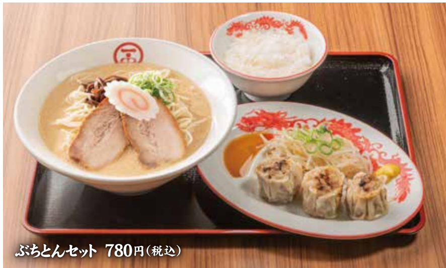
ぶちとんセット 780円(税込)

さらに、「豚骨らーめん ぶちとん 本店」は持ち帰り専用の窓口も併設。中央通り側に設けられた窓口では、シュウマイや弁当の持ち帰り販売を行います。オフィスへの持ち帰りやご自宅へお土産など、ぜひ皆様ご利用ください。