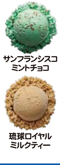
サンフランシスコ ミントチョコ