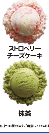
ストロベリー チーズケーキ